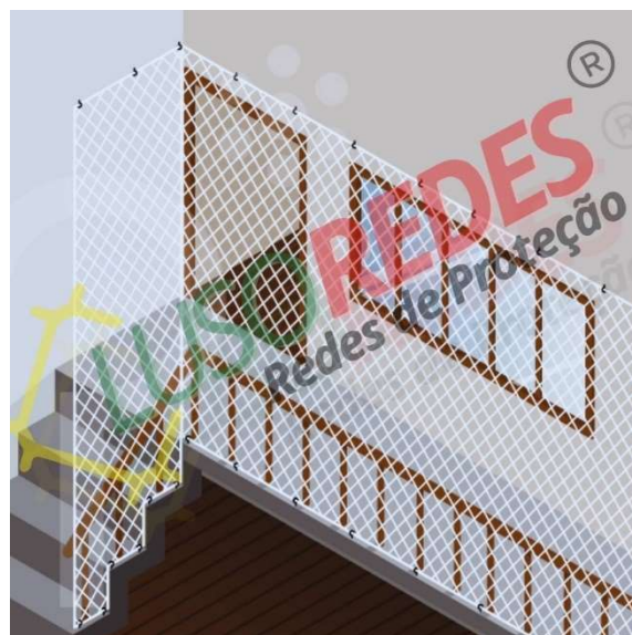
Imagem “ fixação em escadas com corredor”

Sendo a aplicação das redes de proteção estender até o teto. Com a função de proteger crianças, existe o risco que ela escale a mureta. Nesse caso, então, é necessária a instalação da rede de proteção desde o chão até o teto.